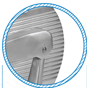
Paralama a profilo continuo Continuous profile blade protection